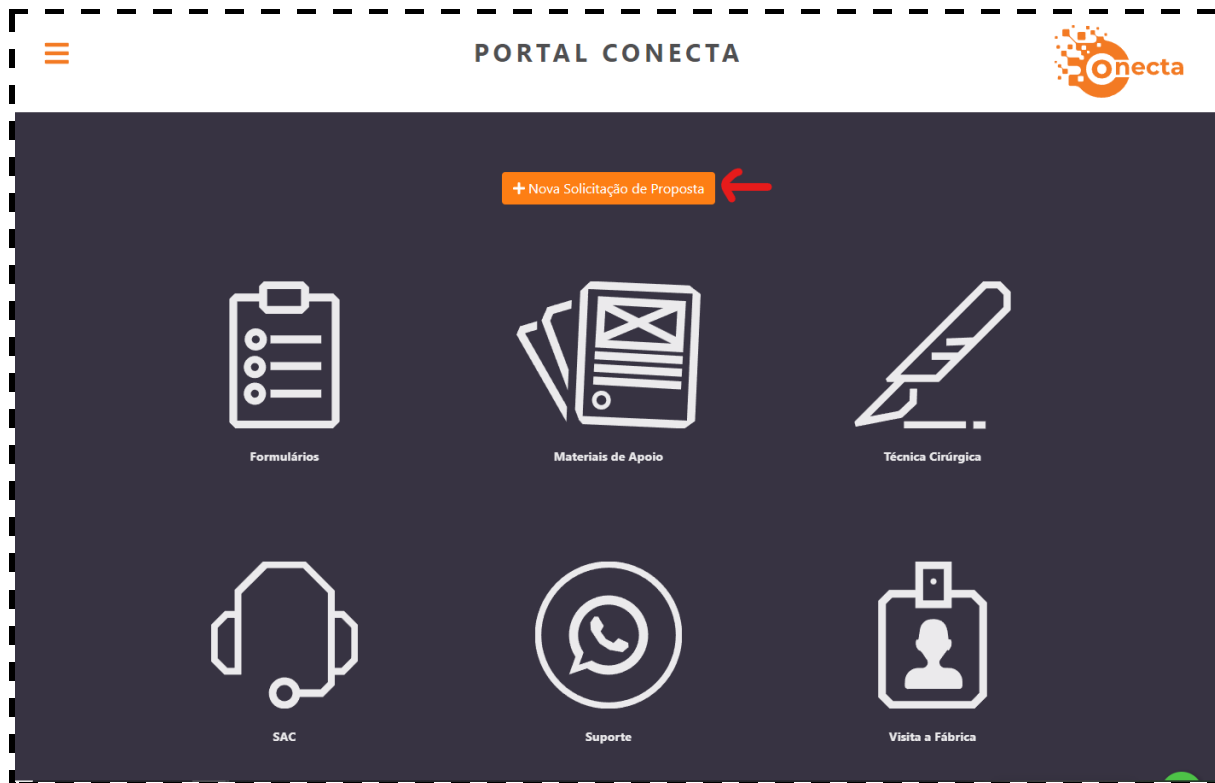
Imagem 6 - Botão de Nova Solicitação de Proposta

A solicitação deve ser feita por meio do próprio cliente, não podendo ser realizada pelo Representante.