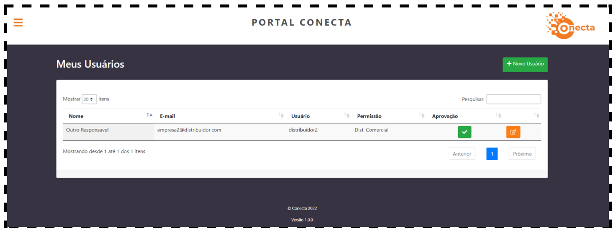
Imagem 4 - Tela de Controle de Usuários Distribuidor Master