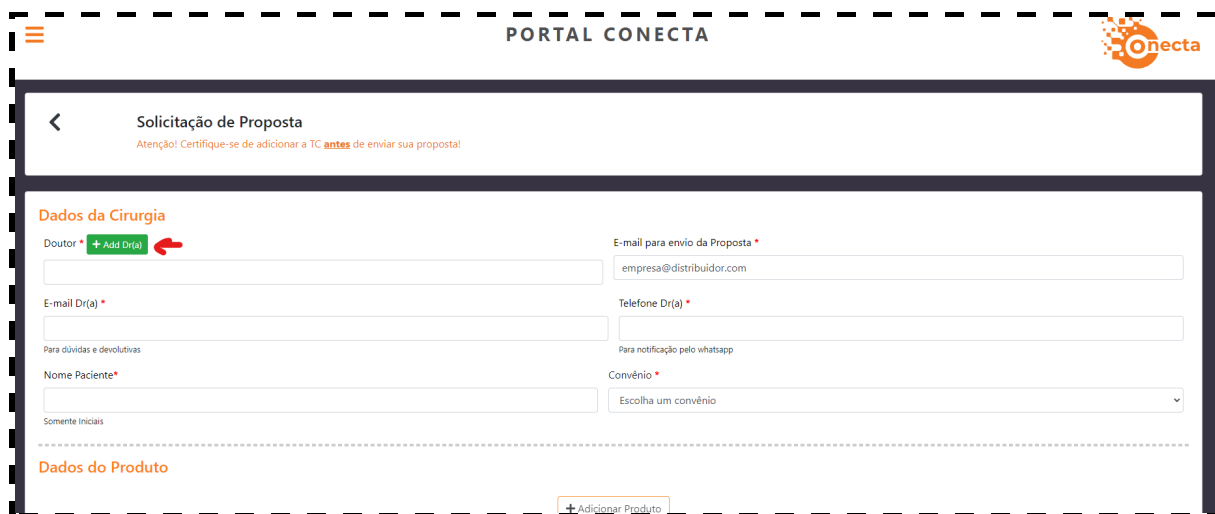
Imagem 7 - Botão para adicionar Doutor(a) à Proposta (Distribuidor)

Ao entrar no formulário, caso o cliente seja Doutor, os dados da cirurgia são populados automaticamente, precisando apenas ser adicionado as iniciais do paciente. Caso o usuário seja distribuidor, fica disponível um botão para adicionar doutores que já foram adicionados ao perfil anteriormente.