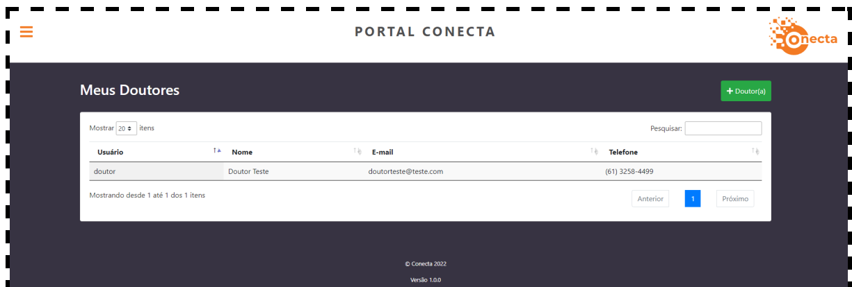
Imagem 5 - Tela de Controle de Doutores Distribuidor Master