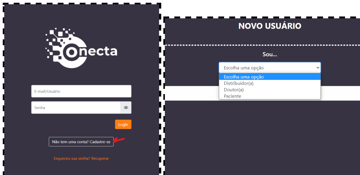
Imagem 1 e 2 - Tela de Login e Tela de Novo Usuário

Essa é uma plataforma nova, portanto todos os usuários devem se cadastrar pela primeira vez. Logo na página inicial tem um botão que indica onde o cadastro deve ser realizado.